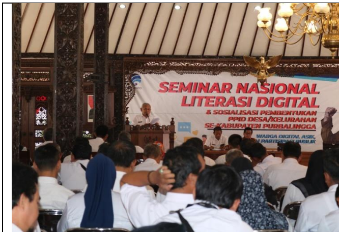
Seminar Nasional Literasi Digital dan Sosialisasi Pembentukan PPID Desa/Kelurahan se-Kabupaten Purbalingga di Pendopo Dipokusumo, 19 Februari 2020