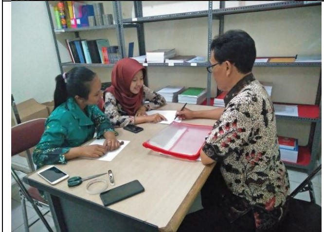
Pendampingan bagi PPID Pembantu dalam mengisi informasi publik di website PPID Pembantu atau OPD di Sekretariat PPID Utama Pemkab Purbalingga