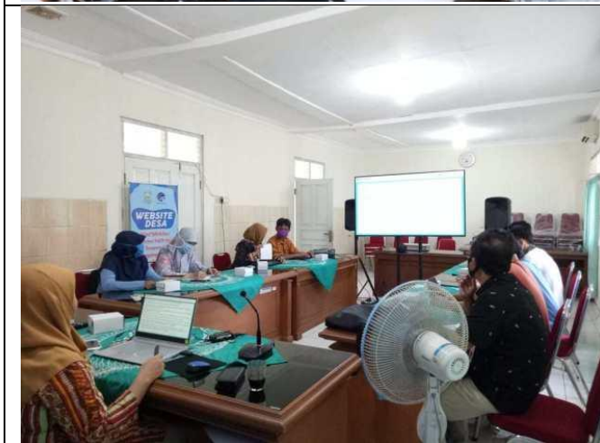
Pendampingan Pembuatan Daftar Informasi Publik (DIP) dan Daftar Informasi yang Dikecualikan (DIK) pada PPID Pembantu